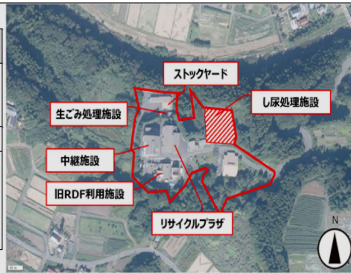
候補地3：みなかみ町奥利根アメニティパーク